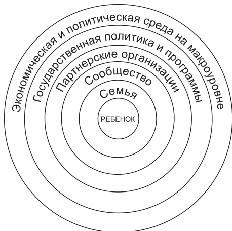
Диаграмма вовлеченных сторон (стейкхолдеров)

1. Понимание роли, которую играют различные вовлеченные в проблему стороны (стейкхолдеры) в игнорировании или нарушении прав детей. Анализ вовлеченных сторон позволит обнаружить связи между теми лицами и институтами, которые несут ответственность и обладают определенными обязательствами в осуществлении прав детей. Как показывает диаграмма, ответственность ложится на семью или законных представителей ре-