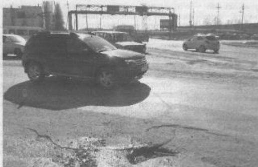
На заседании Общественного Совета будет обсуждаться вопрос о необходимости ремонта проблемного участка дороги на «кольце» по ул. Магистральной.

проекте обязательно должна быть предусмотрена ливневая канализация, так как улица Р.Кузоваткина в весенне-летний и осенне-зимний периоды всегда сильно затоплена, и если не будет предусмотрена ливневая канализация с необходимой пропускной способностью сточных вод, то вложенные 40 млн.рублей вместе с асфальтом «уйдут под воду» и в следующем году придется держать ответ перед жителями, отвечая на вопрос: «Куда вместе с асфальтом делась 40 млн.руб.?» - было услышано! В качестве альтернативы администрация города (пока не упущено время) предложила вынести на обсуждение Общественного Совета вариант перераспределения 40 млн.руб. на ремонт и асфальтирование улицы Магистральной: участка от выезда базы «Таежная» до начала 5-го мкр., т.е. рынка «Пятерочка», для последующего обращения в Департамент дорожного хозяйства и транспорта ХМАО-Югры.