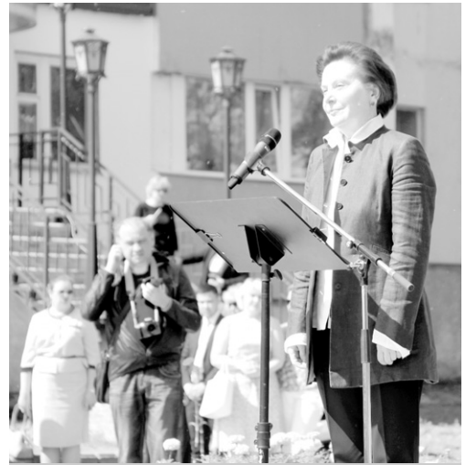
Губернатор Югры Наталья Комарова участвовала в памятных мероприятиях