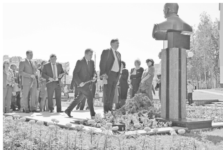
Митинг завершился возложением цветов к памятнику